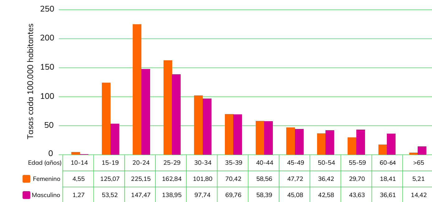
Tasas de sífilis en población general por grupos de edad y sexo. Argentina. SE 1 a SE 52, año 2022. (n=26.656)

Fuente: Sistema Nacional de Vigilancia de la Salud. Dos casos corresponden a personas con sexo legal consignado como no binario, pertenecientes al quinquenio de 25 - 29 La sífilis continúa siendo un problema de salud pública relevante en Argentina, con tasas que demandan una atención constante y estratégica. A pesar de contar con medidas eficaces para su prevención, diagnóstico, tratamiento y control, el desafío radica en la organización e implementación integral de respuestas para minimizar su impacto en la salud de la población.